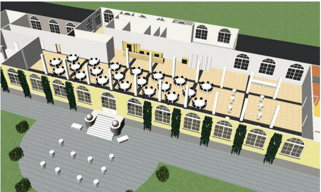
HOCHZEITFEST – 200 PERSONEN