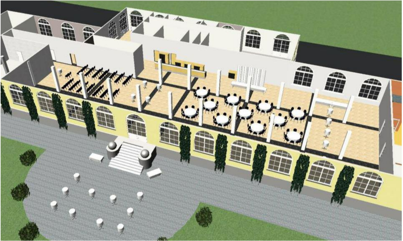
HOCHZEITSZEREMONIE UND ESSEN – 80 PERSONEN