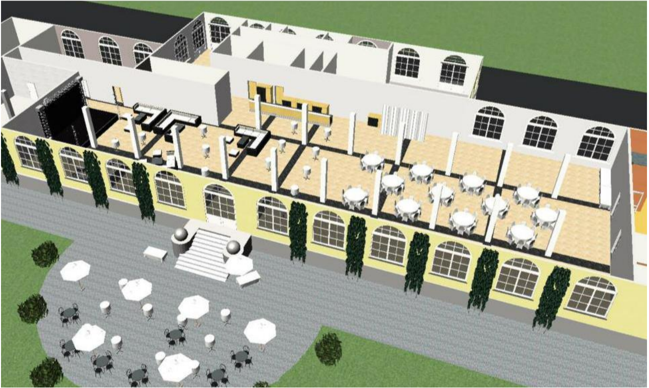
GALAESSEN / BÜHNE / LOUNGE – 100 PERSONEN