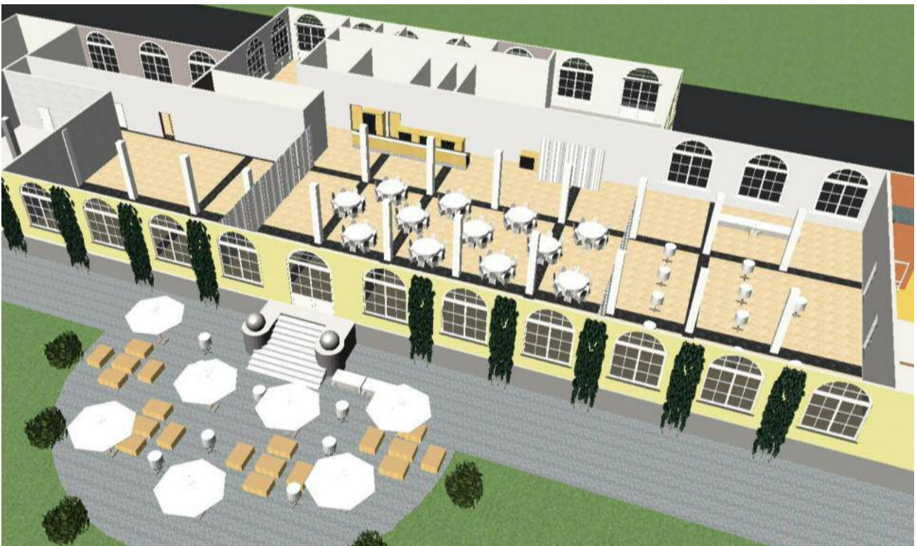
GALAESSEN MIT HUSSEN / PALETTEN LOUNGE – 100 PERSONEN